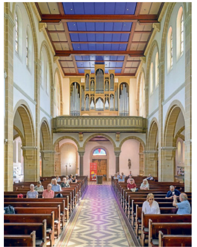
In der evangelischen Jakobuskirche in der Schröderstraße in Neuenheim steht die neueste Orgel der Stadt. Sie wurde erst im vergangenen Jahr gebaut. Sie ist außerdem besonders kompakt.